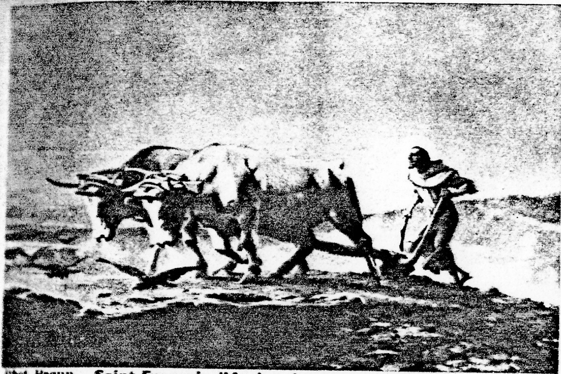
Saint François d'Assise chantant au labour.